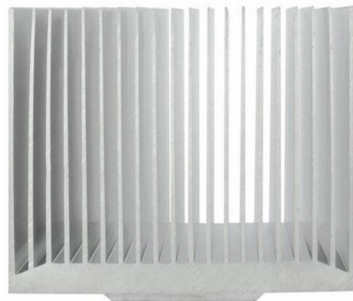
Arctic Apline 11 Passive

Для тех, кто ищет простой и доступный способ создать полностью бесшумный ПК, швейцарская компания Arctic предлагает модель Apline 11 Passive. Этот компактный кулер предназначен для охлаждения ЦПУ Intel с TDP до 47 Вт , что является довольно высоким результатом для низкопрофильной пассивной системы. Кулер выполнен из качественного алюминия, прост в установке и не требует последующего обслуживания , так как не содержит движущихся частей и не забивается пылью. Поставляется Apline 11 Passive с преднанесенным слоем эффективной термопасты Arctic MX-2.