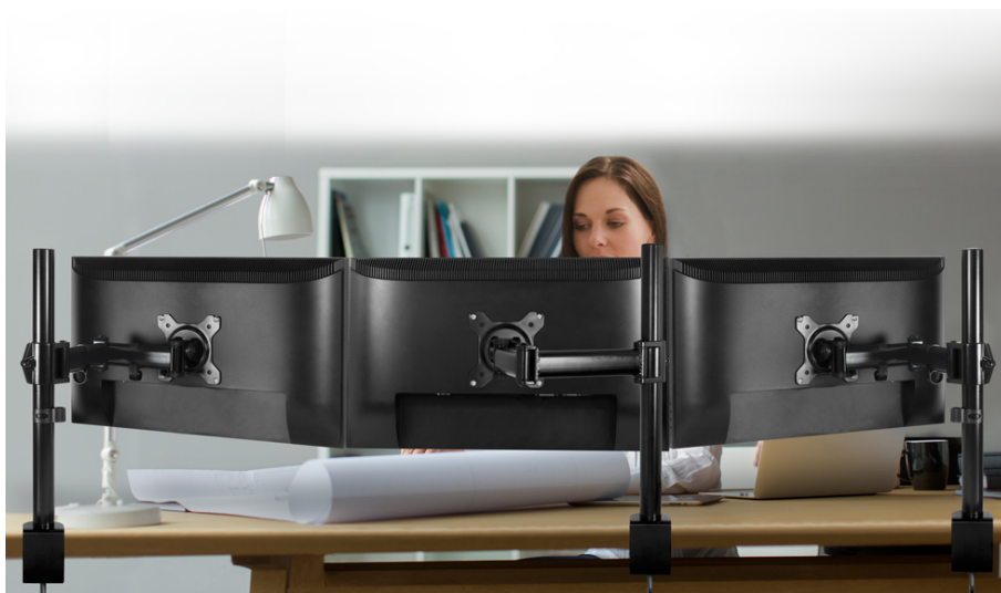
Arctic Z3 Basic — простое решение для удобной и правильной работы с тремя мониторами

Крепления VESA совместимы с большинством мониторов Фиксаторы для проводов позволят аккуратно разместить кабели