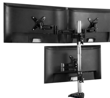
Z1 Pro Gen. 2 с Arctic Z+2 Pro